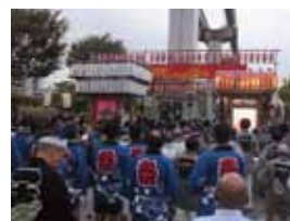
地域のお祭りへの参画